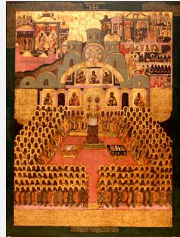
Bisschoppen in concilie bijeen rond de open bijbel (ikoon)

Hoe zal de kerk, door eeuwenlange conflicten verdeeld geraakt en ‘door strijd uiteen gerukt’, al deze aspecten van katholiciteit bijeenhouden en bewaren? De vroege kerk heeft hiervoor drie instrumenten ontwikkeld: de canon (de Bijbel), het credo (geloofsbelijdenis) en het ambt van episkopè (opzicht), persoonlijk en collegiaal gestalte gegeven in de geloofsgemeenschap. Deze drie elementen vormen de waarborg voor de katholiciteit van de kerk. Zij hangen onlosmakelijk met elkaar samen. Maar hun onderlinge samenhang is veelal verloren gegaan. In sommige kerken kwam eenzijdig de nadruk te liggen op een episcopale gezagsstructuur, in andere op de Schrift of de belijdenis en raakte het ambt uit zicht. Het gevolg is dat de ene kerk van Christus uiteengevallen is en daarmee haar katholiciteit verloren heeft.