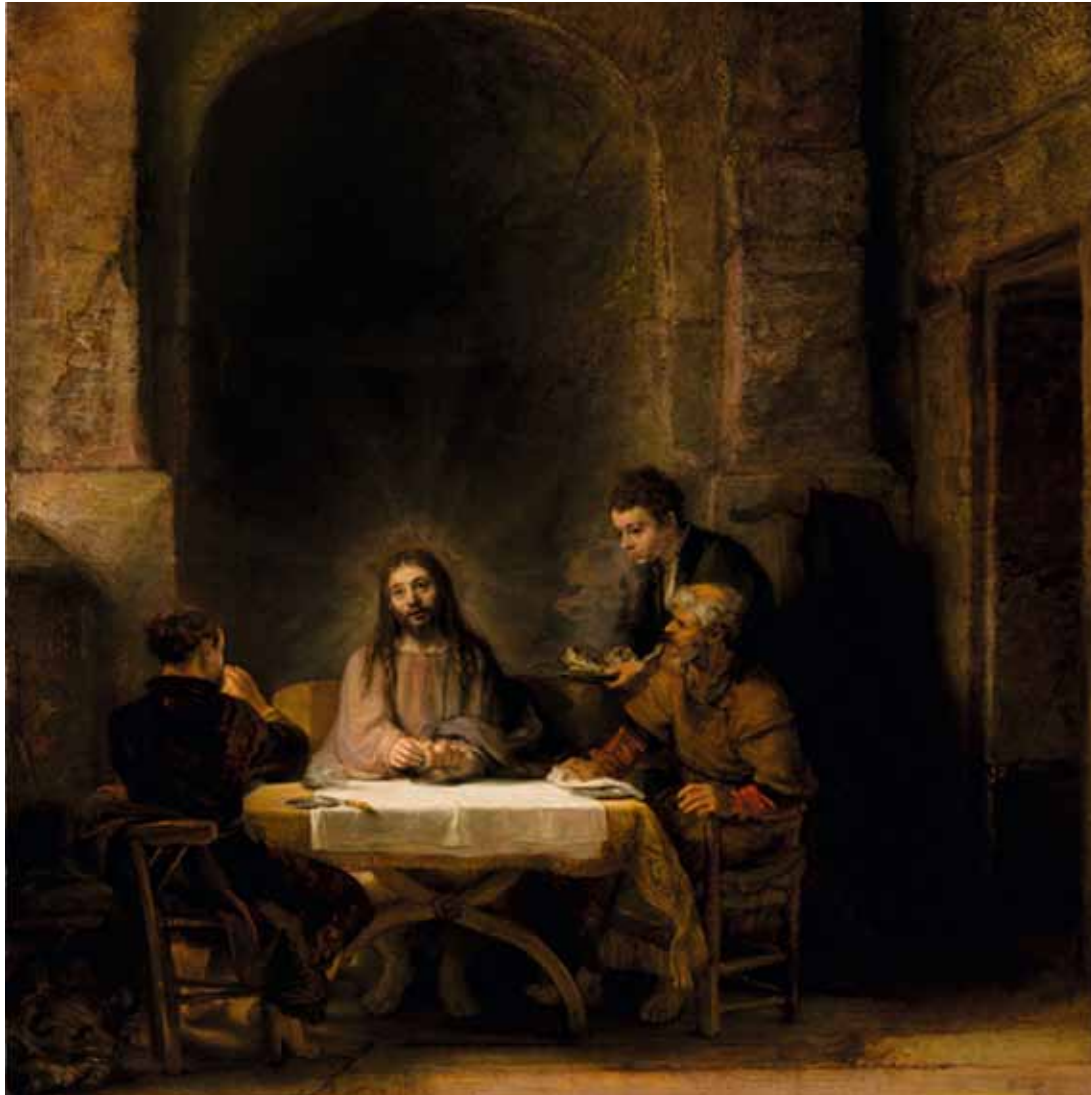
Rembrandt Harmensz. van Rijn, De Maaltijd in Emmaus, olieverf op hout. Musée du Louvre, Paris, France.